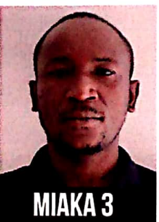
MSHINDI WA SEPTEMBER DICKSON PASKALI MNGERE Simba Logistics Limited