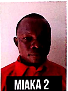
MSHINDI WA AGOSTI SAID RASHID KUMBILO Simba Logistics Limited